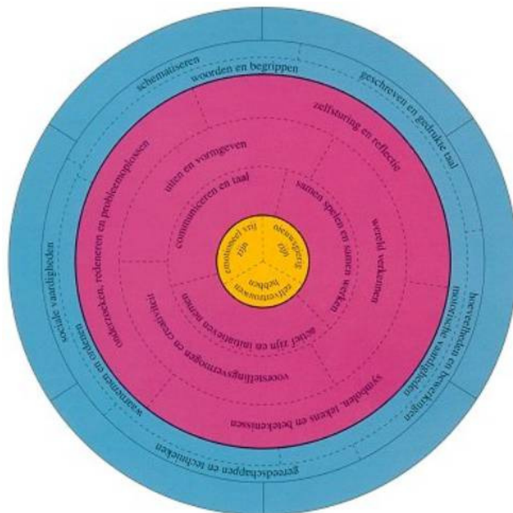
Cirkel doelen van Basisontwikkeling

De samenhang tussen de doelen en de daaraan verbonden ontwikkelings- en leerprocessen worden duidelijk gemaakt in onderstaande cirkel. Als je een onderwijsaanbod voor kinderen ontwerpt, moet dit altijd elk van de drie cirkels raken.